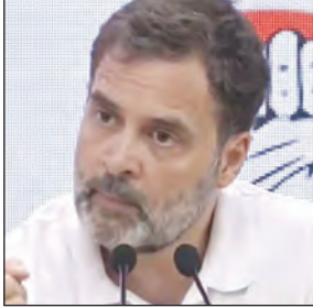
आकर नरेन्द्र मोदी अपनी सरकार को बचाने में व्यस्त हैं। उन्होंने आगे कहा कि 'भारत का मजबूत विपक्ष' लोगों की आवाज उठाता रहेगा और प्रधानमंत्री को जवाबदेही के बिना भागने नहीं देगा। राहुल गांधी ने एक्स पर एक पोस्ट में आरोप लगाया कि पीएम मोदी

टीएम एक्शन इंडिया नई दिल्ली: 18वीं लोकसभा के पहले सत्र का आगाज हुआ। संसद की शुरुआत ही हंगामेपर रही और विपक्ष ने संविधान पर संकट की बात कही। विपक्षी नेताओं ने इसी के साथ प्रोटेम स्पीकर की नियुक्ति का भी मामला उठाया और कहा कि ये गलत काम हुआ है। इस बीच कांग्रेस नेता राहुल गांधी ने केंद्र सरकार पर बड़ा निशाना साधा है। मनोवैज्ञानिक रूप से बैकफुट पर हैं मोदी: राहुल गांधी ने एक्स पर किए एक पोस्ट के जरिए केंद्र सरकार और प्रधानमंत्री मोदी पर निशाना साधा। उन्होंने कहा कि इस सरकार के पहले पंद्रह दिनों में ही कई कमियां सामने आ गई हैं। रायबरेली के सांसद ने आगे कहा कि मनोवैज्ञानिक रूप से बैकफुट पर