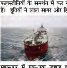
महासागर में एक-एक जहाज को निशाना बनाया था। लाल सागर में हूतियों का हमला

एजेंसी यमन। यमन के पास लाल सागर में एक ड्रोन हमले में एक व्यापारिक जहाज क्षतिग्रस्त हो गया। दो समुद्री सुरक्षा एजेंसियों ने इसकी पुष्टि की। बता दें कि ईरान समर्थित हूतियों ने महत्वपूर्ण व्यापार मार्ग पर हमले की घोषणा की है। यमन के हूतियों ने पिछले कुछ महीनों से ही लाल सागर में जहाजों पर निशाना बनाकर हमले कर रहा है। उनका कहना है कि वह यह हमला गाजा पट्टी में जारी इसाइल हमस संघर्ष में