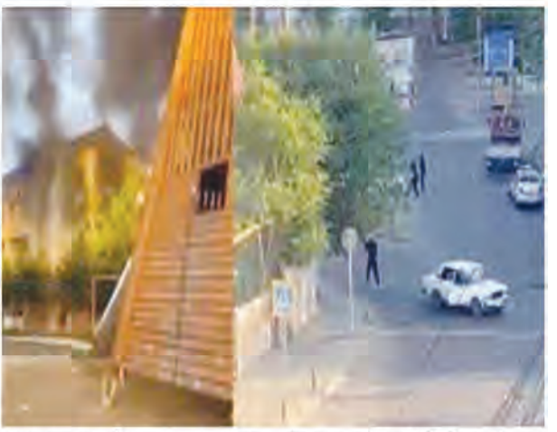
आराधनालय और यातायात पुलिस के एक थाने पर हमला किया। हमले के बाद अधिकारियों ने आतंकवाद विरोधी अभियान शुरू किया।