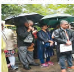
में विस्फोट हो गया था, जो कनाडा द्वारा 'खालिस्तानी आतंकवादियों' द्वारा किए गए कारगराना आतंकी कृत्य के कारण हुआ था। इस घटना में एअर इंडिया के विमान में सवार 86 बच्चों समेत 329 लोगों की मौत हो गई थी। 39 साल बीते, लेकिन... ओटावा में भारतीय उच्चायोग,

एजेंसी ओटावा। कनाडा में आतंकवाद को महिमामंडित करने वाली लगातार हो रही घटनाओं को भारत ने निंदनीय बताया। कहा कि दुर्भाग्यपूर्ण है कि यहां कई मौकों पर ऐसी कार्रवाइयों को नियमित होने दिया जाता है जबकि सभी शांतिप्रिय देशों और लोगों को इसकी निंदा करनी चाहिए। भारतीय उच्चायोग ने 1985 में हुए कनिष्क बम विस्फोट की 39वीं बरसी मनाई। इस मौके पर उच्चायोग ने कहा कि आतंकवाद कोई सीमा, राष्ट्रीयता या नस्ल नहीं जानता। क्या है कनिष्क बम विस्फोट घटना? बता दें, 23 जून 1985 को मॉन्ट्रियल-लंदन-दिल्ली मार्ग पर उड़ान भरने वाले एयर इंडिया 182 कनिष्क विमान में आयरलैंड के तट से दूर अटलांटिक महासागर के ऊपर हवा टोंटों और वैकुंवर में भारतीय वाणिज्य दूतावासों ने श्रद्धांजलि