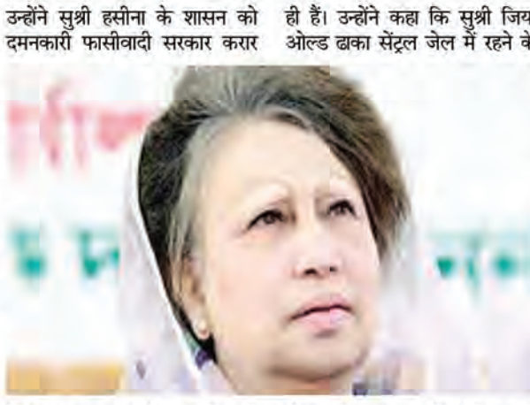
उन्होंने सुश्री हसीना के शासन को दमनकारी फासीवादी सरकार करार दिए हैं। उन्होंने कहा कि सुश्री जिया ओल्ड ढाका सेंट्रल जेल में रहने के

एजेंसी ढाका। बंगलादेश नेशनलिस्ट पार्टी (बीएनपी) के महासचिव मिर्जा फखरुल इस्लाम आलमगीर ने कहा है कि पार्टी अध्यक्ष एवं पूर्व प्रधानमंत्री खालिदा जिया विदेशों में आधुनिक चिकित्सा देखभाल तक पहुंच की कमी के कारण मृत्यु के निकट स्थिति में हैं। ढाका ट्रिब्यून की रिपोर्ट में कहा गया है कि आलमगीर ने प्रधानमंत्री शेख हसीना पर व्यक्तिगत और राजनीतिक प्रतिशोध के चलते जानबूझकर सुश्री जिया को विदेश में उन्नत चिकित्सा उपचार से वंचित करने का आरोप लगाया है, जिसका उद्देश्य उन्हें मौत के मुंह में डकेलना है। आलमगीर ने एक धार्मिक सभा में कहा, यह हमारा दुर्भाग्य है कि हमारी नेता खालिदा जिया इन दिनों विदेशों में आधुनिक चिकित्सा देखभाल तक पहुंच की कमी के कारण मृत्यु के निकट स्थिति में हैं।