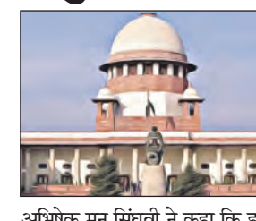
अभिषेक मनु सिंघवी ने कहा कि हाई कोर्ट से जमानत पर रोक अमूर्तपूर्व है, ऐसा आज तक नहीं हुआ है। सिंघवी ने अपनी दलील देते हुए कहा कि अगर हाई कोर्ट से उनकी जमानत रद्द हो जाती तो वह निश्चित रूप से जेल वापस जाएगी। जैसा कि सुप्रीम कोर्ट की अंतरिम जमानत के बाद हुआ था।