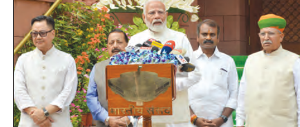
टीएम एक्शन इंडिया

देश चलाने के लिए आम सहमति से आगे बढ़ने के सभी प्रयास किए जाएंगे: मोदी, प्रधानमंत्री ने आपातकाल को बताया भारतीय लोकतंत्र पर काला धब्बा