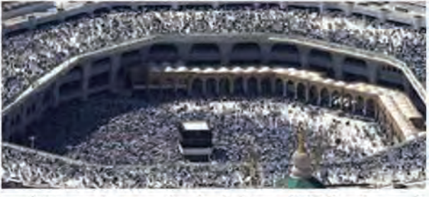
कहा है कि सरकारी स्वास्थ्य सेवा क्षेत्र में भीषण गर्मी से होने वाले तनाव के मामलों की देखभाल की है, जिनमें से कुछ लोग अभी भी चिकित्सा देखभाल में हैं। मृतकों में कई बुजुर्ग और गंभीर रूप से बीमार व्यक्ति शामिल हैं रिपोर्ट में कहा गया है कि शुरूआत में व्यक्तिगत जानकारी या पहचान संबंधी दस्तावेजों की कमी थी, लेकिन अब सभी पीड़ितों की पहचान कर ली गई है और उनके परिवारों को सूचित कर दिया गया है। पहचान, दफन और मृत्यु प्रमाण पत्र जारी करने के लिए उचित प्रक्रियाओं का पालन किया गया। रिपोर्ट के मुताबिक स्वास्थ्य प्रणाली ने आपातकालीन देखभाल एवं सर्जरी से लेकर डायलिसिस तक 465,000 से अधिक विशेष उपचार सेवाएँ प्रदान कीं, जिनमें 141,000 सेवाएँ उन लोगों के लिए भी शामिल हैं, जिन्होंने हज करने के लिए आधिकारिक प्राधिकरण प्राप्त नहीं किया था।

एजेंसी रियाद। सऊदी अरब में हज के मौसम के दौरान 1,301 जायरीन अपनी जान गंवा चुके हैं, जिनमें से 83 प्रतिशत अपजंकिृत थे। सऊदी प्रेस एजेंसी ने देश के स्वास्थ्य मंत्री फहद अल-जलाजेल के हवाले से अपनी रिपोर्ट में