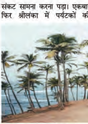
दिलचस्पी वापस आ रही है। श्रीलंका पर्यटन विकास प्राधिकरण के अनुसार, इस वर्ष अब तक 966,604 पर्यटक देश में आ चुके

एजेंसी कोलंबो। दो वर्षों के गंभीर आर्थिक संकट और राजनीतिक अस्थिरता का सामना करने के बाद श्रीलंका की अर्थव्यवस्था तेजी से पटरी पर आ रही है। देश में पर्यटकों की लगातार बढ़ती संख्या इसका संकेत है। राष्ट्रपति रानिल विक्रमसिंघे रूपी सप्ताह सार्वजनिक रूप से स्वीकार कर चुके हैं कि भारत से मिली आर्थिक मदद की वजह से श्रीलंका दो साल के संकट के दौर से उबरने की दिशा में है। पर्यटन पर काफी निर्भर श्रीलंका की अर्थव्यवस्था के लिए अच्छे संकेत दिख रहे हैं। कोरोना काल में चौपट हुए पर्यटन की वजह से देश को दो-तीन साल तक गंभीर आर्थिक संकट सामना करना पड़ा। एकबार फिर श्रीलंका में पर्यटकों की हैं। अकेले जून में अब तक 69,825 पर्यटक आ चुके हैं। इस 112128 पर्यटक श्रीलंका आए हैं। श्रीलंका पर्यटन विकास प्राधिकरण के मुताबिक इस देश में रूस, भारत, जर्मनी, ब्रिटेन, चीन, फ्रांस, ऑस्ट्रेलिया आदि से अधिक पर्यटक आए हैं। 2023 में श्रीलंका आने वाले पर्यटकों की संख्या 14 लाख 87 हजार रही। उल्लेखनीय है कि पिछले शनिवार को श्रीलंका के राष्ट्रपति रानिल विक्रमसिंघे ने कोलंबो में आयोजित 31वीं अखिल भारतीय साझेदार बैठक को संबोधित करते हुए कहा कि दो मुश्किल वर्षों से गुजरने के बाद, मुझे यह स्वीकार करना होगा कि यह इसलिए संभव हुआ क्योंकि भारत ने हमें 3.5 अरब डॉलर का ऋण दिया था। वह सब चुका दिया जाएगा।