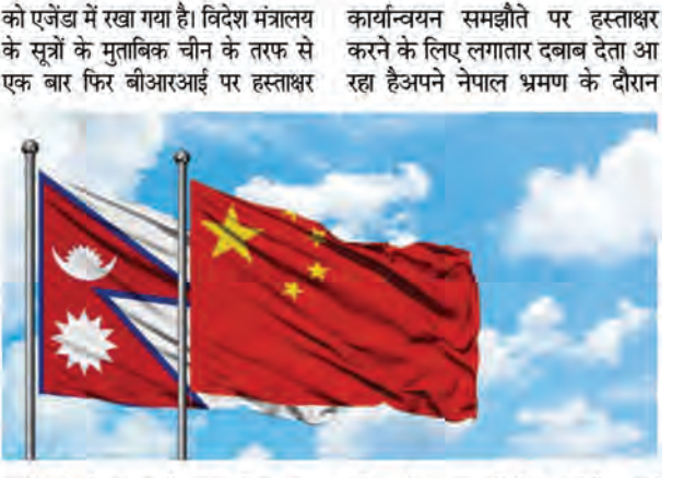
कार्यान्वयन समझौते पर हस्ताक्षर करने के लिए लगातार दबाव देता आ रहा है। अपने नेपाल भ्रमण के दौरान कार्यन्वयन समझौते पर हस्ताक्षर करने के लिए लगातार दबाव देता आ रहा है। अपने नेपाल भ्रमण के दौरान