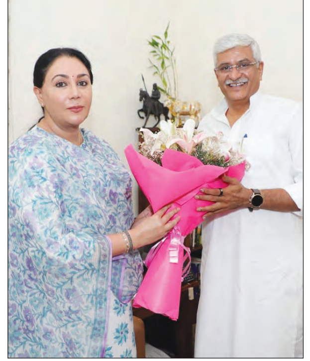
राजस्थान की उप-मुख्यमंत्री ने केंद्रीय मंत्री गजेंद्र सिंह शेखावत से की मुलाकात।

से सबसे ज्यादा पर्यटक उत्तर प्रदेश में आते हैं। इन सकारात्मक परिस्थितियों ने होटल इंडस्ट्री के लिए अपार संभावनाओं को जन्म दिया है। बड़ी संख्या में होटलों की आवश्यकता का अनुभव किया जा रहा है। होटल इंडस्ट्री को प्रोत्साहित करने के लिए हमें अपने बिल्डिंग बाइलॉज में परिवर्तन करने की आवश्यकता है। आवासीय क्षेत्र में 06 कमरों से 20 कमरों तक के होटल निर्माण के लिए न्यूनतम भूमि और होटल तक पहुंच मार्ग की चौड़ाई की न्यूनतम सीमा में बदलाव किया जाना चाहिए। साथ ही, पार्किंग, सिक्वोरिटी और फायर सेफ्टी जैसे अतिमहत्वपूर्ण विषयों में मानक का सख्ती से अनुपालन कराया जाए।