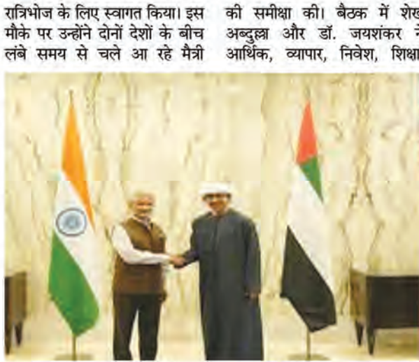
रात्रिभोज के लिए स्वागत किया। इस मौके पर उन्होंने दोनों देशों के बीच लंबे समय से चले आ रहे मैत्री की समीक्षा की। बैठक में शेख अब्दुल्ला और डॉ. जयशंकर ने आर्थिक, व्यापार, निवेश, शिक्षा,

एजेंसी अबूधाबी। विदेश मंत्री एस जयशंकर ने संयुक्त अरब अमीरात (यूएई) के अपने समकक्ष शेख अब्दुल्ला बिन जायद अल नाहयान से रविवार रात अबू धाबी में पर मुलाकात की और लगातार बढ़ती द्विपक्षीय रणनीतिक साझेदारी पर चर्चा की। डॉ. जयशंकर ने एक्स पर अपने पोस्ट में लिखा, 'यूएई के विदेश मंत्री अब्दुल्ला बिन जायद से अबू धाबी में मिलकर बहुत खुशी हुई। हमारी लगातार बढ़ती व्यापक रणनीतिक साझेदारी पर सार्थक और गहन बातचीत हुई। क्षेत्रीय और वैश्विक मुद्दों पर उनकी अंतर्दृष्टि सरहनीय रही।' यूएई विदेश मंत्रालय के एक रीडआउट के अनुसार शेख अब्दुल्ला ने डॉ. जयशंकर को फिर से भारत के विदेश मंत्री बनने पर बधाई दी यूएई के शीर्ष राजनयिक ने कल रात अबू धाबी में डॉ. जयशंकर का