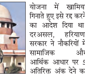
योजना में खामियां गिनाते हुए इसे रद्द करने का आदेश दिया था। दरअसल, हरियाणा सरकार ने नौकरियों में सामाजिक और आर्थिक आधार पर 5 अतिरिक्त अंक देने का फैसला किया था। हरियाणा सरकार के इस फैसले को दखल देने से इनकार कर दिया है। सुप्रीम कोर्ट ने हरियाणा सरकार से हाई कोर्ट में ही अपनी बात रखने को कहा। पंजाब और हरियाणा हाई कोर्ट ने हरियाणा सरकार की इस

नई दिल्ली: सुप्रीम कोर्ट ने हरियाणा सरकार की नौकरियों में सामाजिक और आर्थिक आधार पर पांच अतिरिक्त अंक देने के राज्य सरकार के फैसले को असंवैधानिक ठहराने के पंजाब और हरियाणा हाई कोर्ट के फैसले में दखल देने से इनकार कर दिया है। सुप्रीम कोर्ट ने हरियाणा सरकार से हाई कोर्ट में ही अपनी बात रखने को कहा। पंजाब और हरियाणा हाई कोर्ट ने हरियाणा सरकार की इस