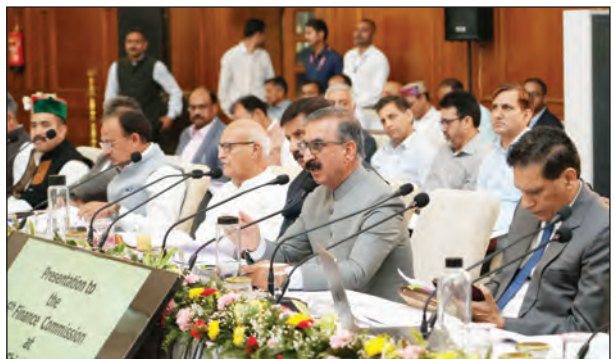
प्रदान करने की सिफारिश का अग्रह किया। मुख्यमंत्री ने राष्ट्रीय सुरक्षा के दृष्टिगत प्रदेश के सीमावर्ती क्षेत्रों के विकास तथा इन क्षेत्रों में रहने वाले लोगों को मूलभूत सुविधाएं प्रदान करने पर बल दिया, ताकि इन क्षेत्रों से स्थानीय लोगों का पलायन रोका जा सके। उन्होंने कहा कि प्रदेश प्राकृतिक आपदा की दृष्टि से संवेदनशील राज्य है,

शिमला: राज्य सरकार ने यहां 16वें वित्त आयोग से जुड़ी हिमाचल प्रदेश की वित्तीय आवश्यकताओं तथा अन्य मुद्दों पर 16वें वित्त आयोग के प्रतिनिधिमंडल के समक्ष विस्तृत प्रस्तुति दी। यह प्रतिनिधिमंडल प्रदेश के तीन दिवसीय प्रवास पर है, जो आगामी पांच वर्षों के लिए हिमाचल के संबंध में अपनी सिफारिश देगा। मुख्यमंत्री ठाकुर सुखविंदर सिंह सुक्ख ने वित्त आयोग के समक्ष राज्य के हितों से जुड़े मुद्दों को उठाया तथा राष्ट्र निर्माण में प्रदेश के योगदान को देखते हुए उदार वित्तीय सहायता